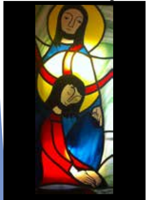
9 - Lavement des pieds