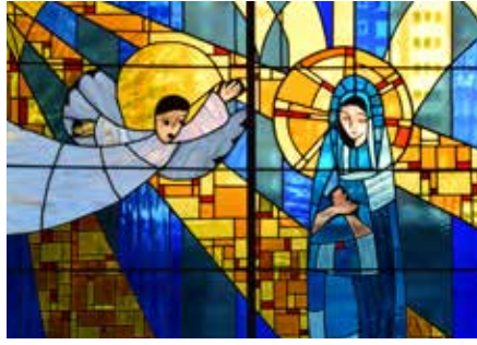
2 - Annonciation