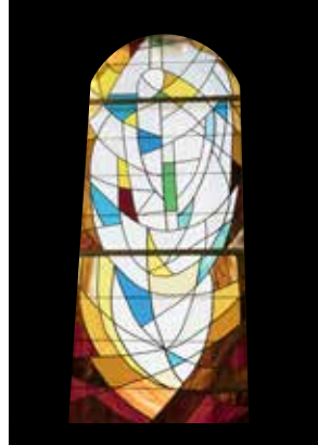
7 - Résurrection