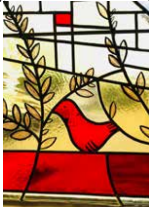
15 - oiseau Notre-Dame