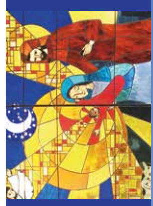
13 - Nativité