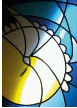
12 - Saint Esprit