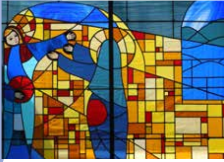
1 - Visitation