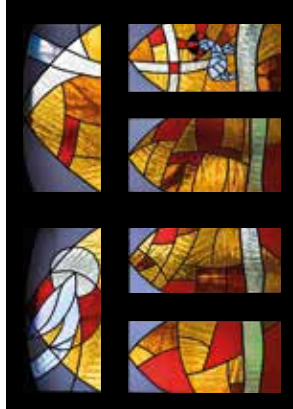
5 - Je suis le chemin