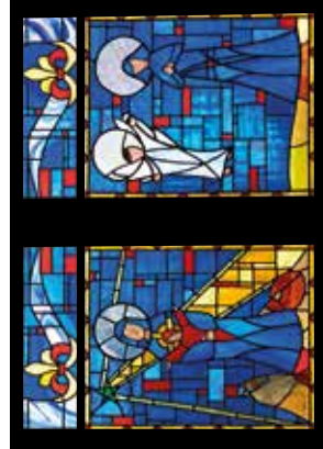
6 - Annonciation et Nativité