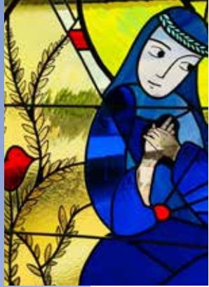
14 - Notre-Dame de Meslay