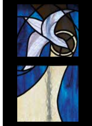
8 - Veni Sancte Spiritus